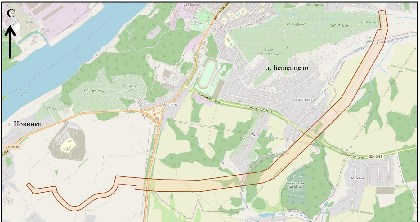
Схема границ подготовки документации по внесению изменений (арх. № 195/22)